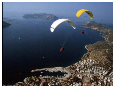
Kort från Kas. En stad med nattliv restauranger och pubar.