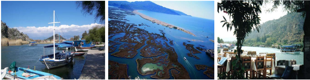
Ekincik ( Caunus and Dalyan)