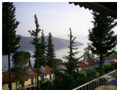
Foto från Cold water Bay